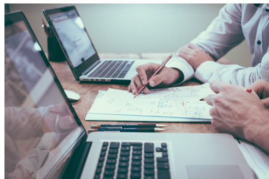
Tagung EUropa in der Schule