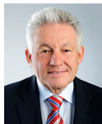
Landeshauptmann Dr. Josef Pühringer