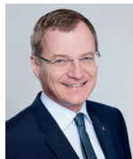
Landeshauptmann-Stv. Mag. Thomas Stelzer